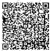
สิ่งที่ส่งมาด้วย

กองบริหารงานท้องถิ่น กลุ่มงานวิชาการและวิจัยเพื่อการพัฒนาท้องถิ่น โทร. ๐ ๒๒๔๑ ๙๐๐๐ ต่อ ๒๒๑๒ โทรสาร ๐ ๒๒๔๓ ๑๘๑๒ ไปรษณีย์อิเล็กทรอนิกส์ saraban@dla.go.th